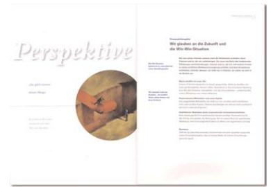
Geschäftsbericht für IT-Unternehmen