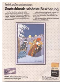
Milka und Jacobs Weihnachtspromotion