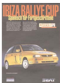
Auto-Anzeige Seat Ibiza