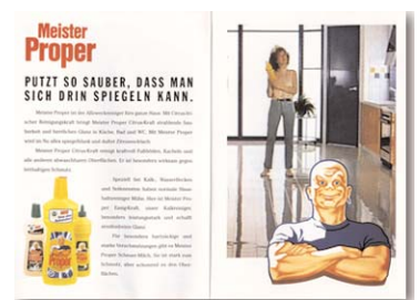
Flyer für Sampling-Promotion Procter & Gamble